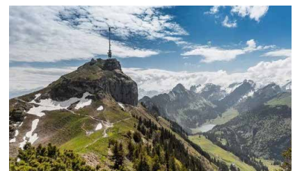
Hoher Kasten mit Drehhotel

Die Seniorenferien 2025 im Kirchentrio finden vom 10. – 13. Juni 2025 in Gais AR statt. Die Ausschreibung erfolgt Mitte Januar 2025. Die Teilnehmerzahl ist beschränkt, Anmeldungen werden in der Reihenfolge des Eingangs berücksichtigt. Auskunft bei Christina Campolongo, 079 778 98 53 oder ch.campolongo@kirchdorf.ch